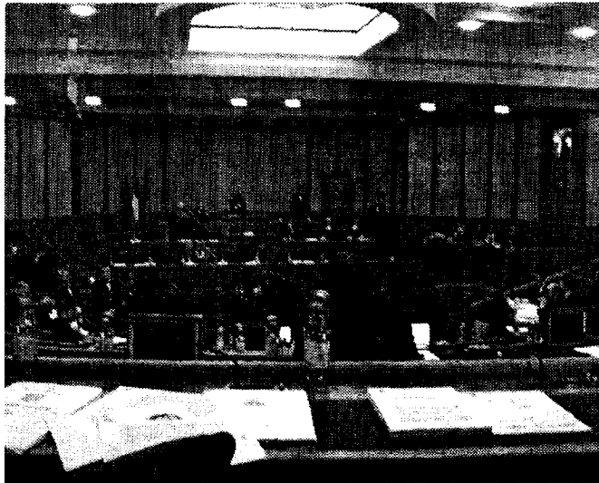
Il consigliere di An Marzocchi polemico sull'assenza dell'assessore Ranucci al festival sull'Innovazione in corso all'Ara Pacis a Roma