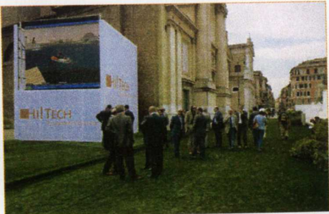
Giardino dell'Innovazione Ara Pacis, Roma

le altamente manipolabile», e quindi persistente prolungamento in pixel di ciò che è la nostra rappresentazione ideale. Del resto, SL si prefigura come un mondo socializzante nel quale la costruzione estetica, specificamente giocata fra il feticismo e la provocazione, detta le regole dell'inserimento e dell'accettazione nella comunità amplificando quelli che sono ormai i modelli pubblicitari che hanno investito la nostra esistenza reale. Per dirla alla Gerosa: «la vera violenza sta nella cultura della replica del reale e quindi nel calo d'inventiva e di fantasia dei residenti».